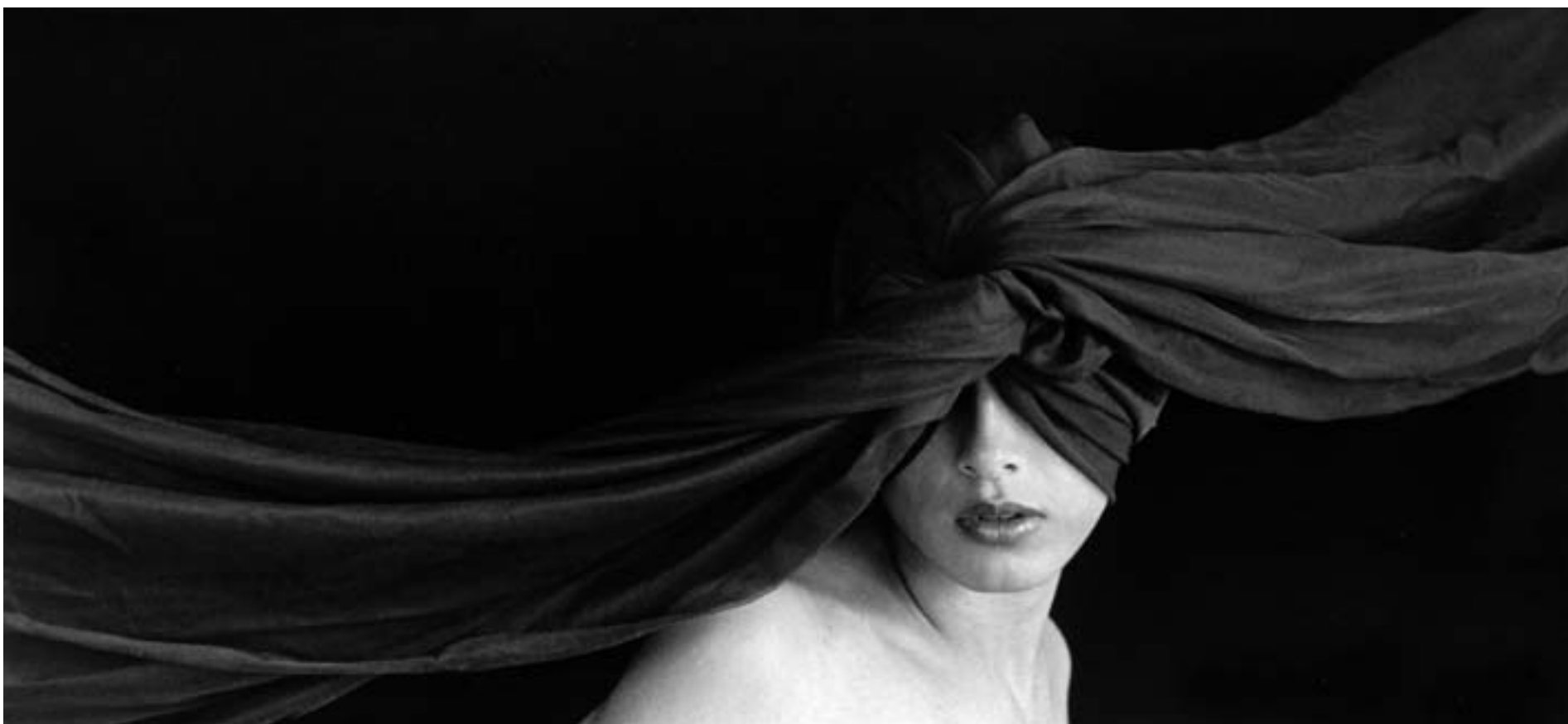
de la serie "La máquina de luz"

No estoy, no he estado, ni estaré frente a este espejo. Ruby no existe, nuestro amor es sólo una escala que Thelonious Monk consagra a saltos de intervalos de quinta. No es su piano el que no deja de sonar en mi cabeza, soy yo el que no deja de ser engendrado mientras la música no pare su discurso. Ruby y yo somos su imagen, su delirio improvisado a fuerza de síncopas y cadencias en donde cada nota tiene una profunda magia estelar, cada una de éstas engendra un acontecimiento. La , un hombre en donde el piano no deja de sonar; Mi , un cuartucho perdido, a nadie le interesa saber en qué sitio; Si , un espejo que no refleja sino lo que un hombre quiere ver; Fa , una mujer; Do , un amor truncado; Sol , un hombre que cuestiona; Re , hombre que se ha dado cuenta que no ha dicho nada, que tal vez ni siquiera ha existido; La , un fuerte aplauso, la improvisación ha terminado. Mañana, dependiendo del humor, el maestro Monk nos deleitará con más música. Veremos qué universos serán destruidos o creados en ese momento. Por hoy, ya se ha dicho demasiado. ♦