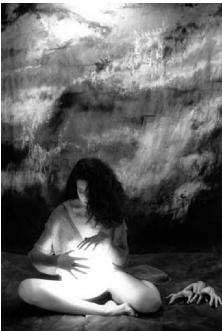
© JORGE CLARO LEÓN / de la serie "La máquina de luz"