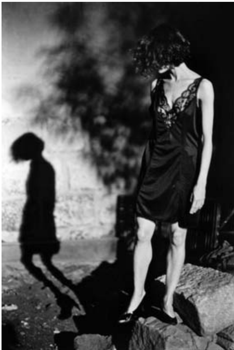
© JORGE CLARO LEÓN / de la serie "La máquina de luz"